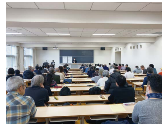
前回の試験でも、多くの方が受験しました